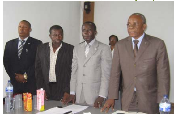
(derecha a izquierda) S.E. Ministro de Educación, Ciencia y Deportes, Director General de Planificación y Programación Educativa, Delegado Regional de Bata y Director Adjunto de PRODEGE